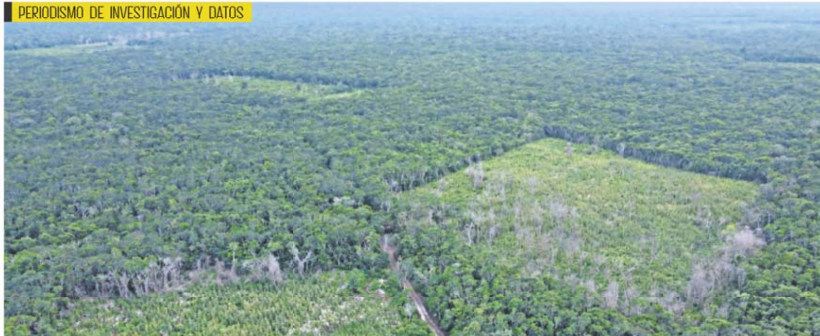
Diego Prado, El Universal