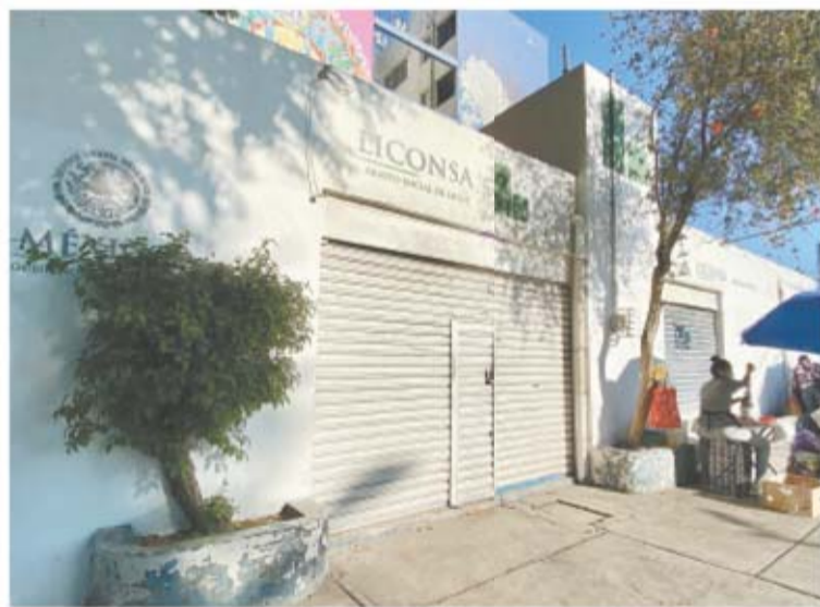
Berence Precoso/El Universal