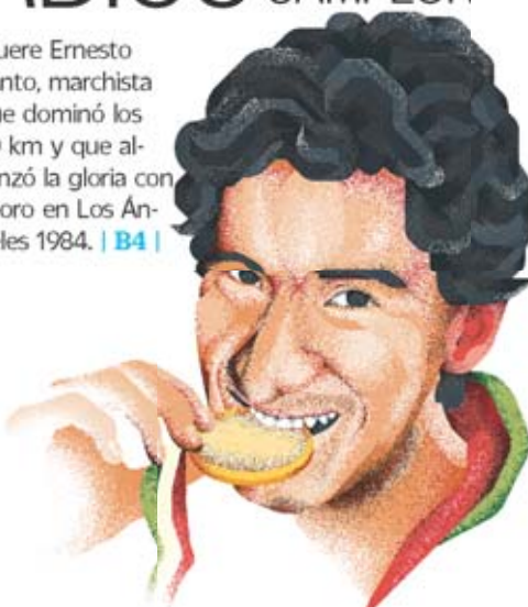
ILUSTRACIÓN: DANIEL BAZO

Muere Ernesto Canto, marchista que dominó los 20 km y que alcanzó la gloria con el oro en Los Ángeles 1984. | B4 |