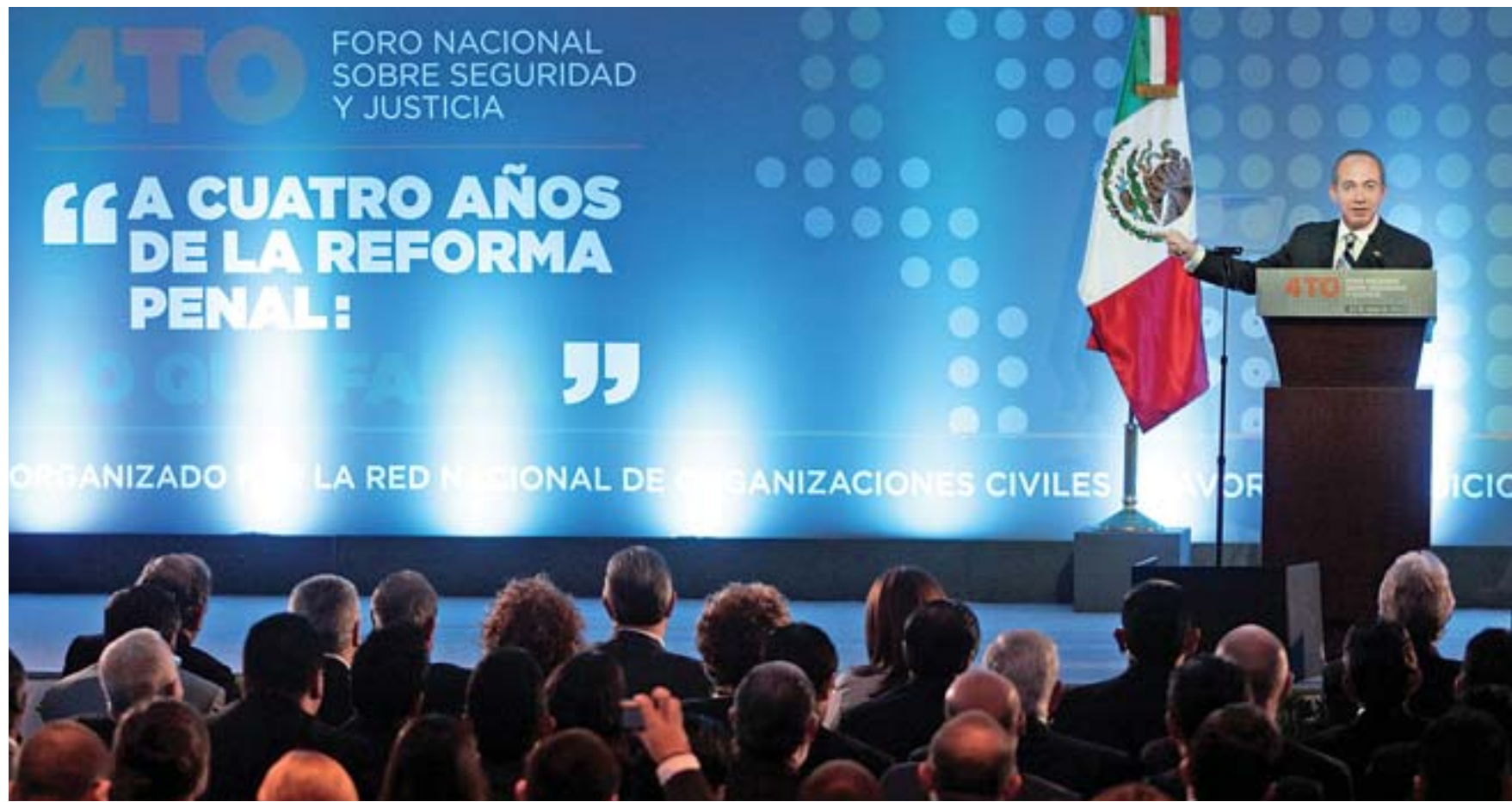
EXHORTO. Durante la inauguración del Cuarto Foro Nacional sobre Seguridad y Justicia, el presidente Felipe Calderón llamó al Poder Judicial a dialogar “sin resentimiento ni recriminaciones” diversos temas, como el hecho de que criminales sean sentenciados para luego salir con un amparo bajo el brazo

El presidente Calderón también arremetió contra los estados y señaló que el robo del monedero, el asalto en microbuses o al estudiante de secundaria, o la secretaria que es violada al salir de su trabajo, es lo que no atienden las autoridades locales.