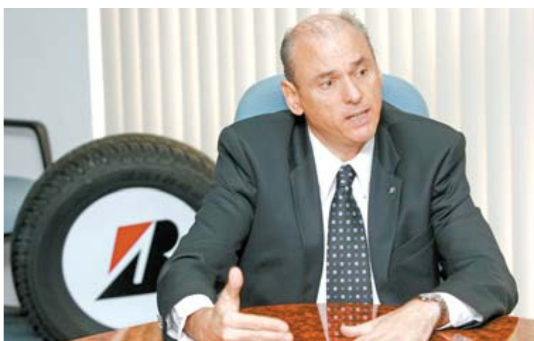
RETO. Ariel Depascuali, director general de Bridgestone