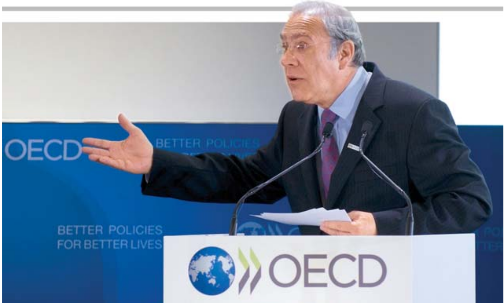
PANORAMA. El secretario general de la OCDE, José Ángel Gurría, pronuncia un discurso durante la sesión inaugural del Foro anual de la OCDE celebrado en París

los trabajadores. Sin embargo, alertó que el problema de los créditos de nómina se presentan en algunas Sociedades Financieras de Objeto Múltiple (Sofomes), que negocian con las áreas financieras empresas y que ofrecen tasas de interés más altas que el promedio del mercado. Además, alertó, tampoco cuentan con ninguna supervisión.