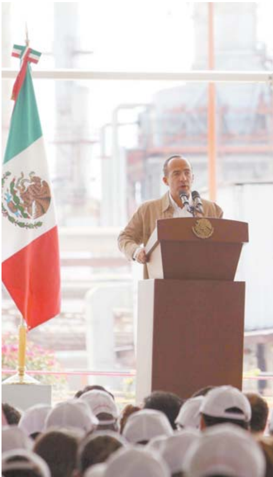
ESPECIAL EL UNIVERSAL

La firma mexicana de electrodomésticos, Mabe, invertirá 17,5 mdd en Argentina entre 2010-2011. Los recursos estarán dirigidos a ampliar la producción de heladeras y cocinas e instalar una línea de fabricación de lavadoras. (EFE)