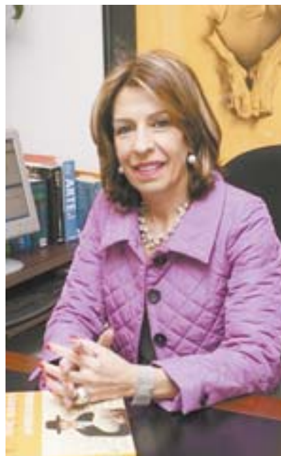
ESPECIALISTA. El texto es una de las principales obras de la experta en arte

“Lo que caracteriza a Magritte es que hacía sus cuadros pensando en la realidad mundial y no partía de un