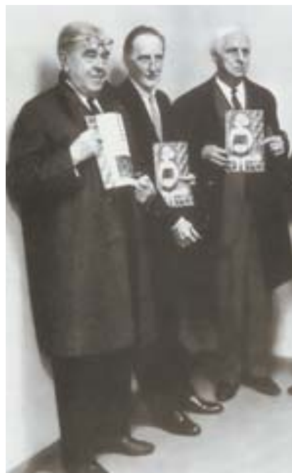
CÍRCULO SURREAL. René Magritte con Marcel Duchamp y Max Ernst

“Magritte es considerado el poeta de la imagen, y sin duda el representante más destacado del surrealismo belga pues