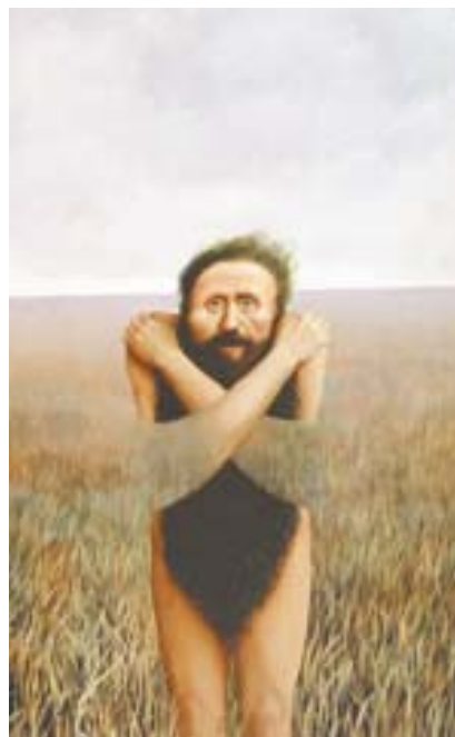
EN EL LUGAR DE LOS ABRAZOS. El trabajo de Castañeda es autobiográfico

rebelde que se aleja del concepto de un movimiento ortodoxo apegado a la evocación de los sueños y el inconsciente, hecho que lo ha destacado en la escena artística nacional”, cita Lara.