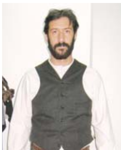
JOSÉ MARÍA YAZPIK.