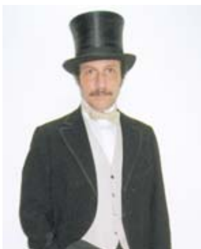
DANIEL GIMÉNEZ CACHO.