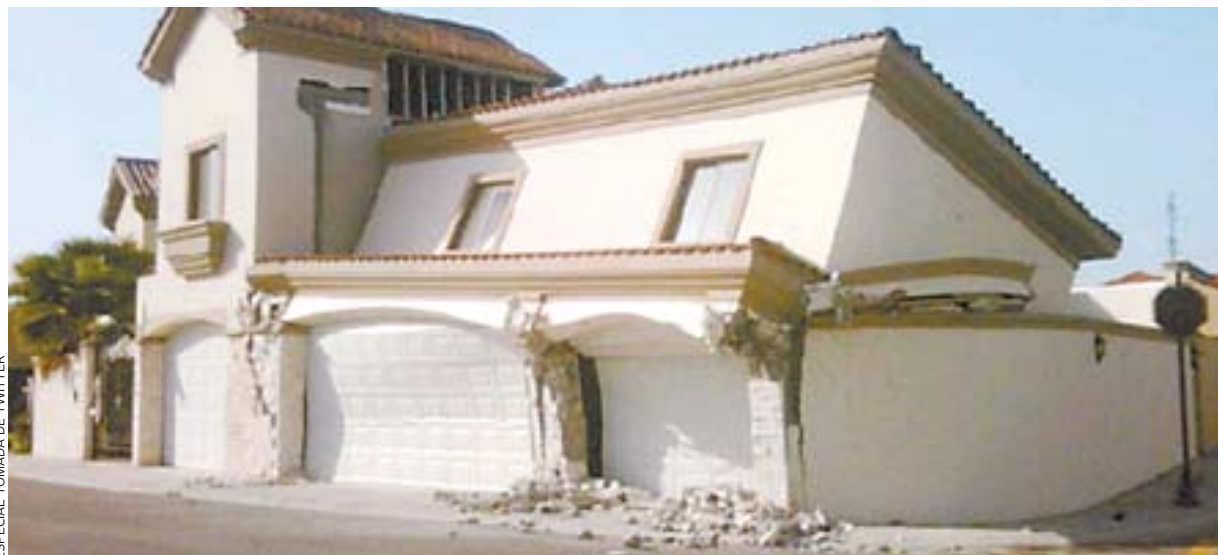
ESPECIAL TOMADA DE TWITTER