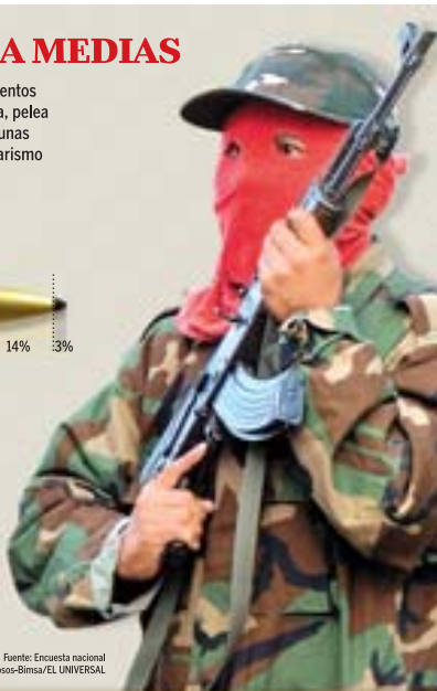
Fuente: Encuesta nacional Ipsos-Bimsa/EL UNIVERSAL