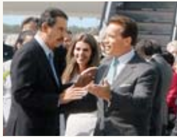
RECEPCIÓN El presidente Vicente Fox llegó ayer a Sacramento. Lo recibió el gobernador de California, Arnold Schwarzenegger; observa su esposa Maria Shriver

Fox expresó "un verdadero gusto" porque millones de personas salen ahora de la "oscuridad y la discriminación". [MÉXICO: A8]