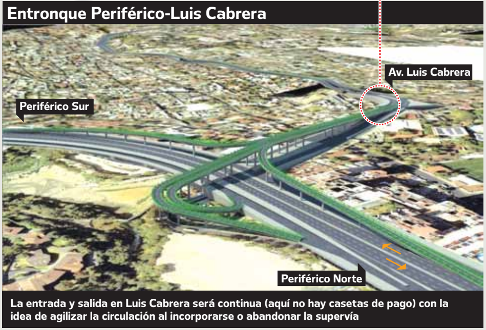
La entrada y salida en Luis Cabrera será continua (aquí no hay casetas de pago) con la idea de agilizar la circulación al incorporarse o abandonar la supervía

Reducirá en gran medida las emisiones de CO 2 , NO x , SO 2 , al agilizar la movilidad de los automóviles y el transporte público