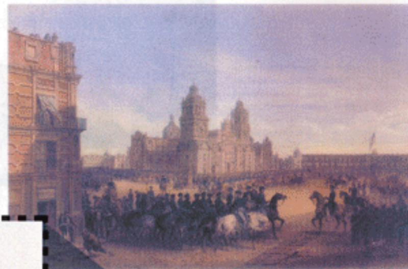
(1847) que representa la entrada del ejército estadounidense a la Ciudad de México después de derrotar a las fuerzas nacionales.

La derrota militar, la muerte de miles de soldados y la pérdida de la mitad de su territorio representaron un gran golpe para México. Dura