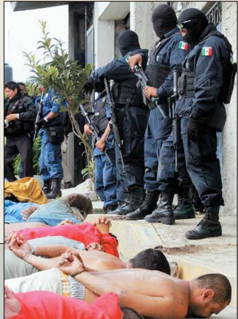
Hace dos años elementos de la AFI se enfrentaron a una banda de secuestradores en el estado de México, presuntamente miembros de "La Familia"; detuvieron a 15 personas

3.72 delitos diarios se reportaron en 2010 mientras que en 2005 fueron 0.89