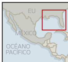
Área en detalle

La fuga de crudo está a tres días de cumplir un mes. Inició frente a Louisiana, pero las corrientes dispersaron la mancha en dos sentidos: una a Texas y otra hacia Alabama y Florida