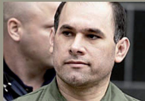
Osiel CÁRDENAS GUILLÉN

Extraditado a los Estados Unidos en 2007