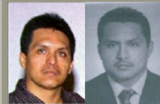
Miguel Ángel TREVIÑO MORALES "L-40" o "Cuarenta"