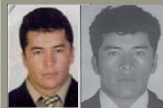
Heriberto LAZCANO LAZCANO "LAZCA" o "Z-3" o "Verdugo"