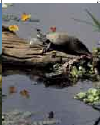
DE AQUÍ A LA BIODIVERSIDAD. Un jaguar, especie amenazada, todavía presente en Bahuaja-Sonene. En esta área protegida también viven 232 especies de peces y tortugas como la taricaya.