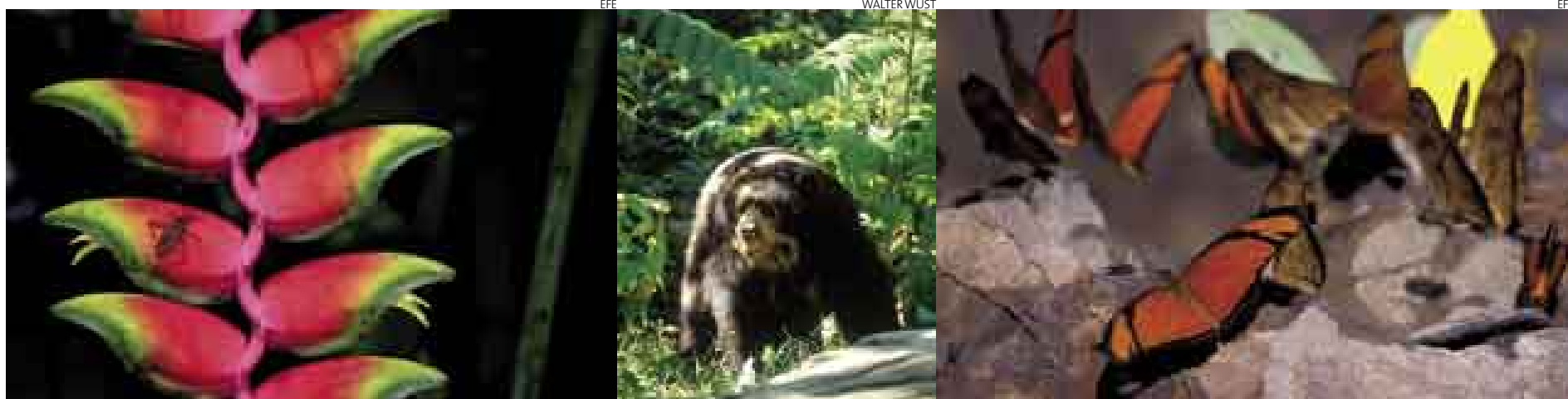
> RÉCORDS Y PELIGROS. Hay por lo menos 20 mil especies vegetales, 174 de mamíferos (algunas en peligro, como el oso de anteojos) y 1,200 especies de mariposas, un dispendioso récord mundial.

El pequeño nos ve y sube por una playita, pero se resbala, como un niño desprotegido. La mamá husmea detrás de un arbusto, sorprendida. El rumor de las aguas se mezcla con el ruido armonioso que viene de la jungla.