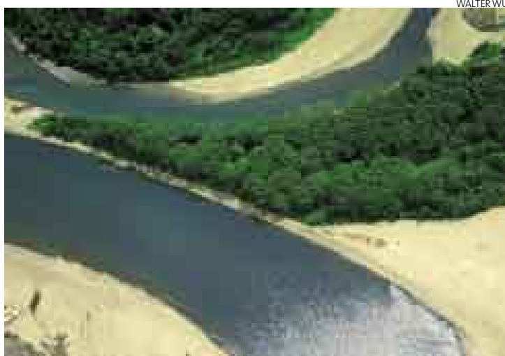
> RÍOS, BOSQUES Y PLAYAS. Los ecosistemas de Bahuaja-Sonene son diversos.